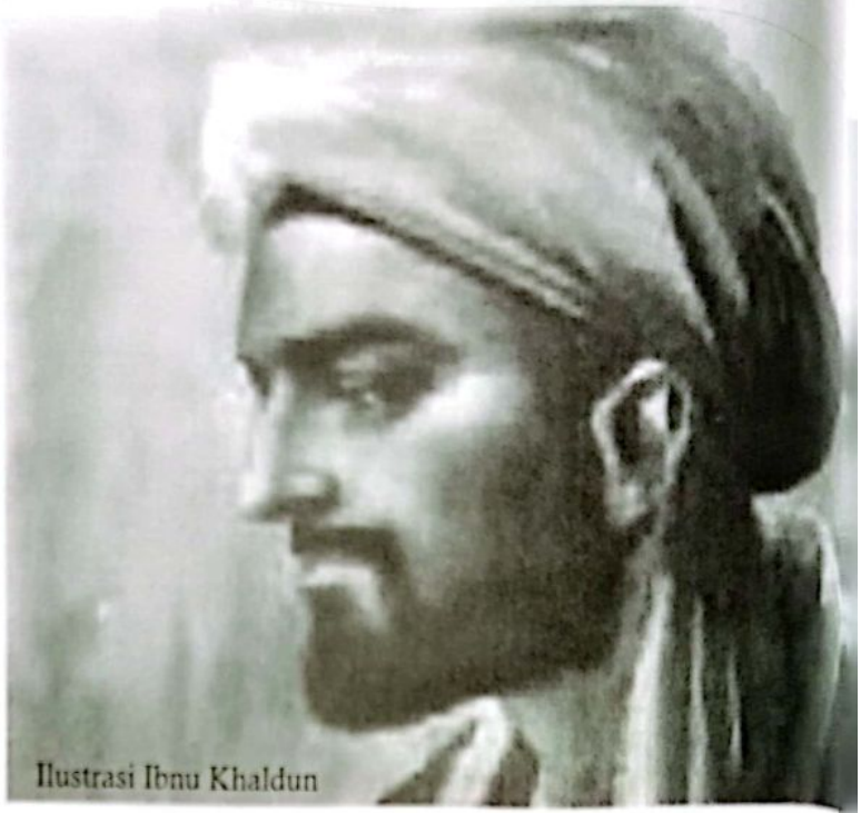
Ilustrasi Ibnu Khaldun

Tiga tokoh ulama Islam terkemuka, Ibnu Khaldun (1332-1406), Ibnu Taimiyah (1263-1338) dan Imam Syathibi menguraikan bahwa maju mundur suatu bangsa/kaum akan selalu ditentukan oleh "keinginan" kaum itu sendiri. Keinginan ini tidak dapat diukur dengan gerakan segelintir aktifis untuk maju. Tetapi keinginan yang dimaksudkan adalah keinginan